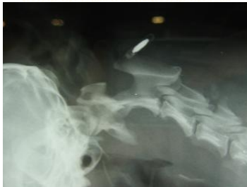
Foto 1.- Aumento del espacio entre atlas y axis a nivel dorsal que confirma el diagnóstico de luxación atlanto-axial.