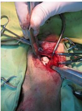
Foto 6.- Vista intra-operatoria con el cemento oseo uniendo a los implantes de tornillos y agujas.