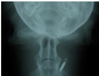
Foto 2.- Ausencia de apófisis odontoides.