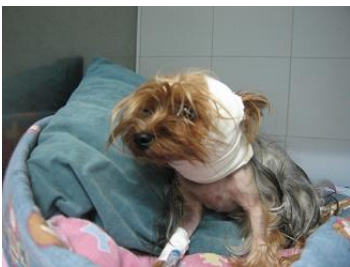
Foto 9 .- El animal estuvo los primeros 5 días con reposo en jaula y vendaje cervical.