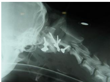
Foto 7.- Radiografía post-operatoria que muestra una correcta alineación y menor distancia entre atlas y axis. Proyección latero-lateral.