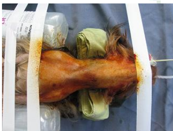
Foto 3.- Vista del campo quirúrgico instantes antes de empezar la cirugía.